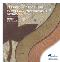
Les bétons décoratifs Tome 2 sur 3 Entretien, rénovation