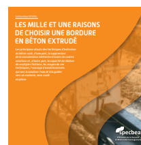
Les bordures en béton extrudé Technique, choix, conseil