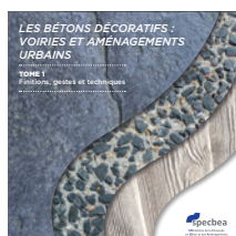
Les bétons décoratifs Tome 1 sur 3 Finitions, techniques